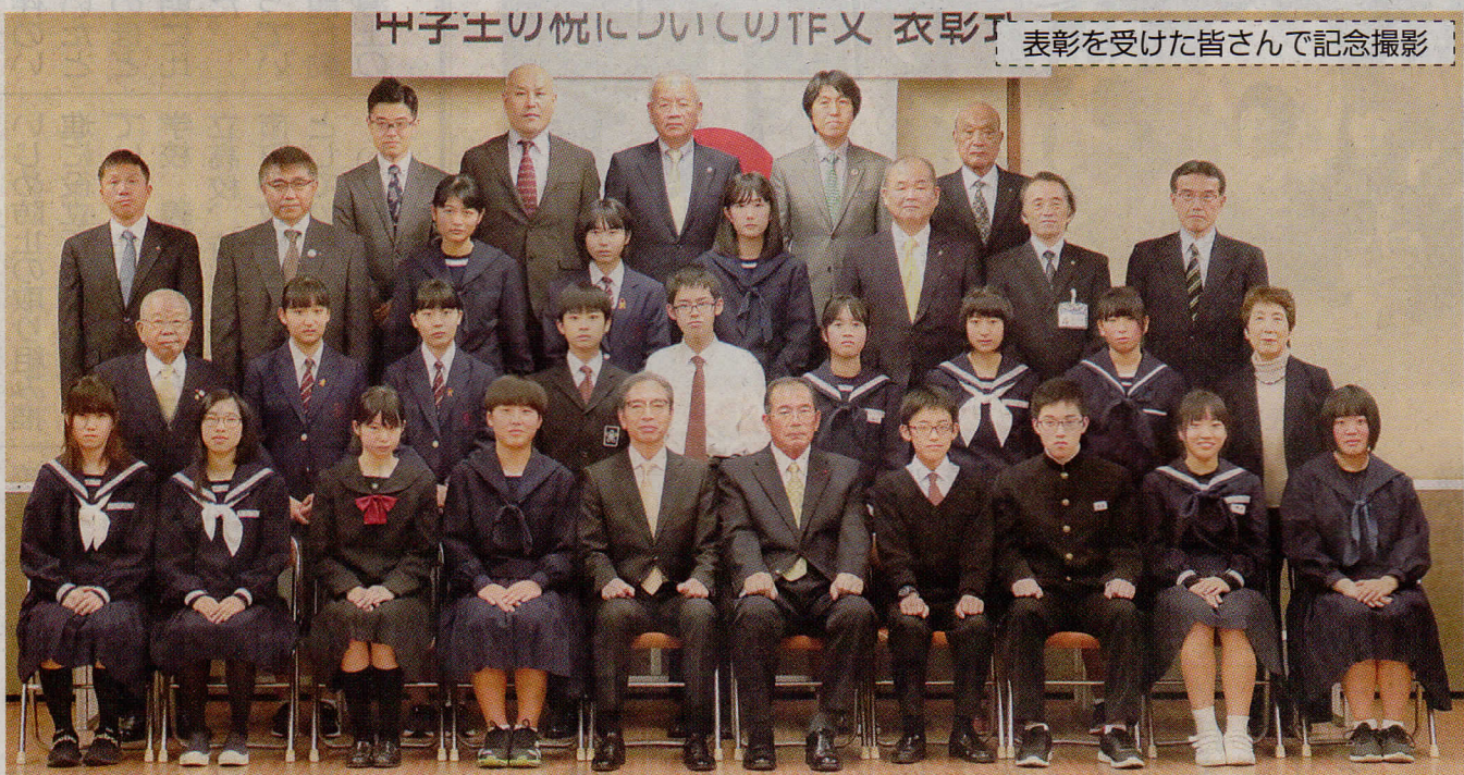
表彰を受けた皆さんで記念撮影